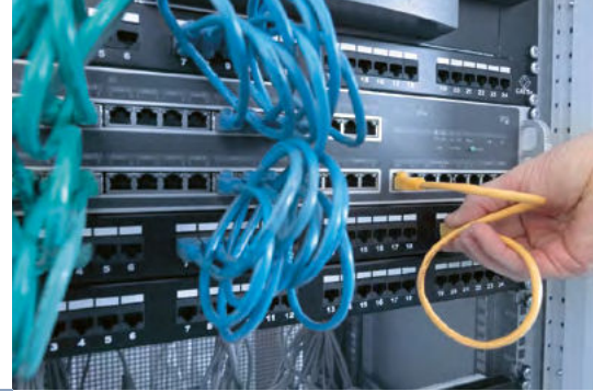
INTUS ACM80e Rack mit Patch-Panel