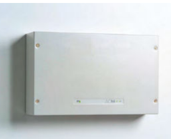
INTUS ACM80e Wand

Der Zutrittskontrollmanager: Schaltzentrale eines Zutrittskontrollsystems, ausgestattet mit einem leistungsfähigen Rechner, eingebunden in ein Sicherheitssystem mit dezentral verteilter Intelligenz. Von einem zentralen Leitreechner mit variierenden Stammdaten versorgt, trifft der Zutrittskontrollmanager im Rahmen der definierten Raum- und Zeitprofile die Entscheidung, ob eine Tür geöffnet werden darf oder nicht. Selbst beim Ausfall des Netzwerkes zum Leitreechner steuert er zuverlässig die angeschlossenen Zutrittsleser, die Türen mit ihren Überwachungskontakten, die Schranken, Drehsperrn oder die angeschlossene Videoaufzeichnung. Auch für Lösungen in der Cloud geeignet.