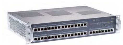
INTUS ACM80e Rack